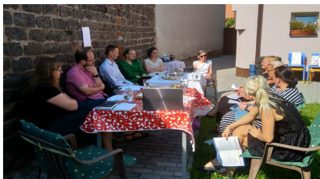
Foto: Setkání mezioborového týmu na téma Sociální a návazné služby pro lidi se ZP a pečující v ORP Dobříš

Během projektu jsme ve všech územích organizovali mezioborová setkání, kterých se účastnili poskytovatelé sociálních a návazných služeb, zástupci měst a obcí, odborníci i pečující rodiny. Jednotlivá setkání se věnovala vždy konkrétnímu tématu či problému, které se ukázalo jako důležité (z našich analýz, z konzultací s rodinami či odborníky). Tématy setkání tak byly například vznik denního stacionáře (Hořovice), vznik sdružení pečujících rodičů nebo řešení dopravy dětí se ZP (Beroun) nebo vytváření pracovních příležitostí a bydlení pro lidi se ZP (Dobříš).