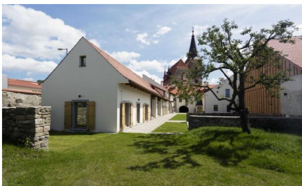
Foto: Nadační dům Nadace Adelaida, Chvalšiny Zdroj: Nadace Adelaida

Hlavním smyslem pobytů je umožnit pečujícím rodinám si alespoň na několik dnů odpočinout od každodenních starostí. Každý pobyt nabízel individuálně připravený program, který kombinoval odpočinkové aktivity (relaxační techniky, arteterapie, rehabilitace apod.), a program zaměřený na zvládnutí role pečujících. Programy vedli zkušení lektoři, kteří jsou součástí externího týmu spolupracovníků projektu. V době, kdy probíhal program pro rodiče, probíhal současně program pro jejich děti.