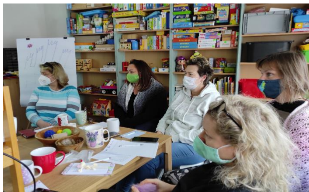
Foto: Seminář pro pečující s Kristýnou Farkašovou, Beroun

Cílem vzdělávacích aktivit bylo nabídnout pečujícím odborné semináře z různých oborů. Témata a konkrétní zaměření jednotlivých setkání byla většinou účastníkům „šita na míru“. Z vlastních analýz i rozhovorů s pečujícími jsme získali náměty, o jaké informace a oblasti by nejvíce stáli. Zájmu pečujících jsme pak přizpůsobili nabídku seminářů. 7