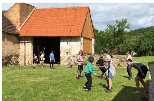
Foto: Psychorehabilitační pobyty pro pečující rodiny, Chvalšiny

Celkem bylo v rámci 7 psychorehabilitačních pobytů podpořeno 79 NP (část pečujících jezdí opakovaně).