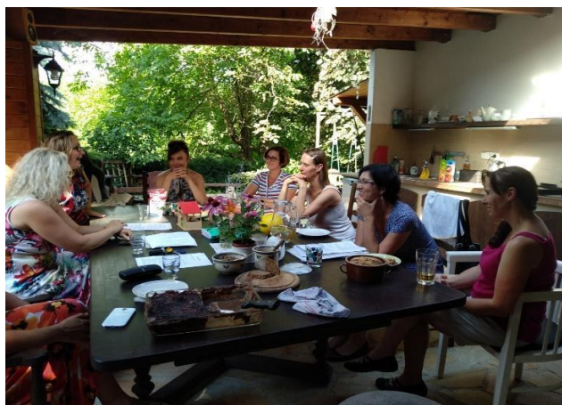
Foto: Setkání pečujících rodičů ze spolku SpoluSvět, Beroun

Na Berounsku vznikla díky odborné podpoře CPKP svépomocná skupina rodičů dětí se zdravotním znevýhodněním. Její členové posléze založili sdružení rodičů SpoluSvět, z.s. Aktivita spolku se zaměřují především na podporu pečujících rodin, nabídku volnočasových aktivit pro jejich děti nebo vzdělávacích aktivit pro rodiče. Vzdělávací aktivity či svépomocná setkání jsou odborně i finančně podporovány v rámci projektu.